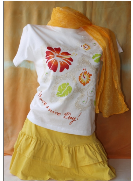
Variante 2: „Hawaii Flower“