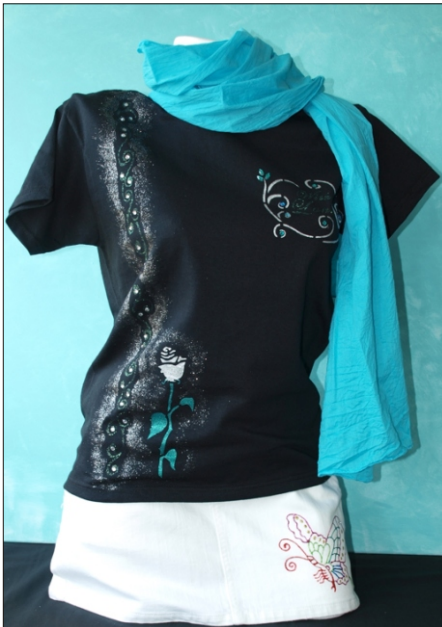
Variante 1: „Romantic Rose“