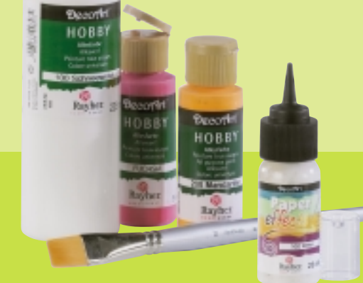
DecoArt Allesfarbe Rayher Pinsel