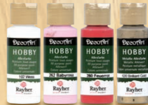
Trendfarben „Pleasure“ und „Beautiful Moments“

Besondere Geschenke liebvoll verpackt und kreativ dekoriert.