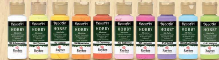
Trendfarben „Freshness“ und „Garden Party“

Tipps für den Außenbereich: Farbenfrohe Vogelhäuser