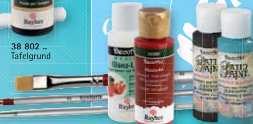
38 043 000, DecoArt Glanz-Lack für Innen und Außen