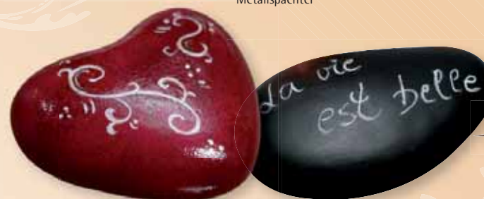
89 106 02 Tafelkreide