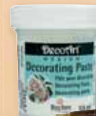
38 036 000 DecoArt Decorating-Paste