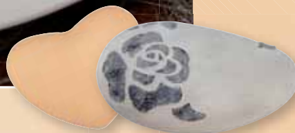
38 031 00, Metallspachtel